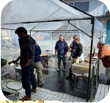
係の方が外でおそばを茹でています