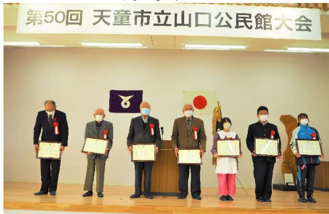
第50回 天童市立山口公民館大会