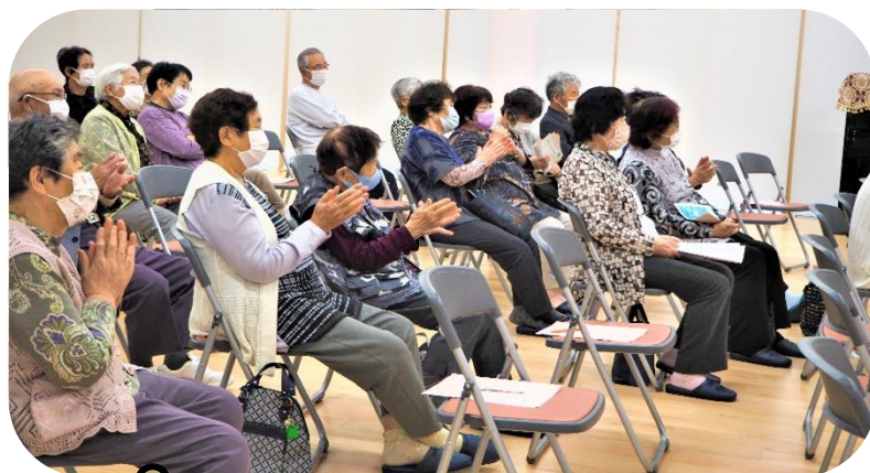
↑ みとちゃんに釘付け!