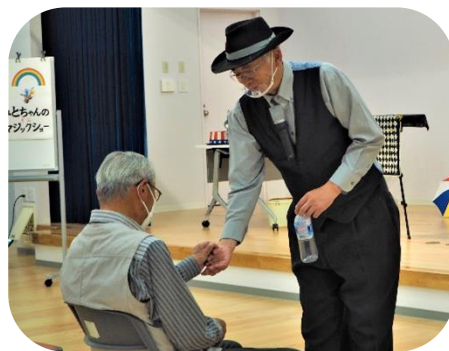
↑ 会員の方にもお手伝いしてもらいました