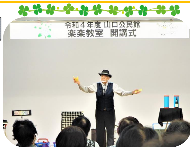
令和4年度 山口公民館 楽楽教室 開講式