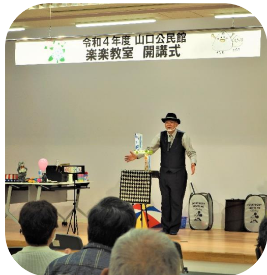
↑ 身近にあるもの(ボックスティッシュ)であなたもマジシャンになれるかも?