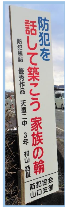
荒原線・48号線 交差点付近