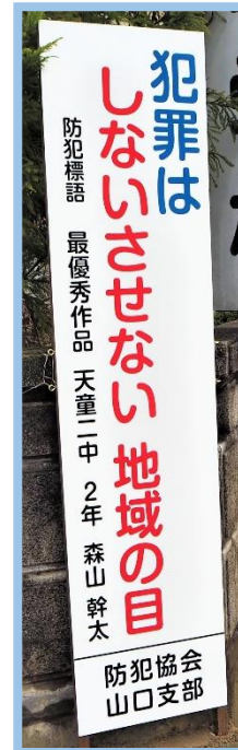
天二中前歩道橋付近