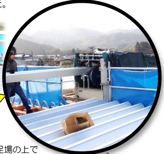
足場の上で 波型に成型しているところ 🙌