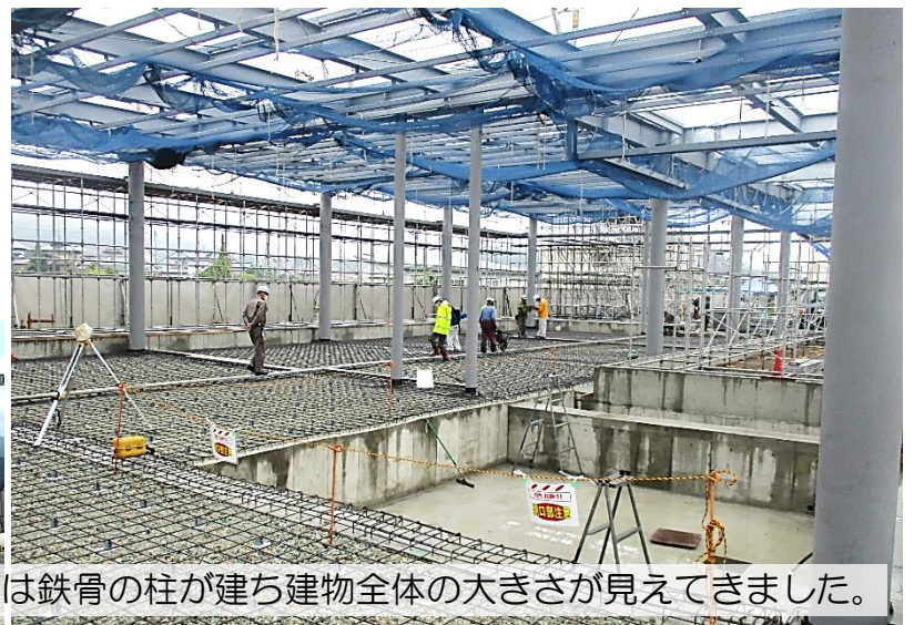
10月は鉄骨の柱が建ち建物全体の大きさが見えてきました。