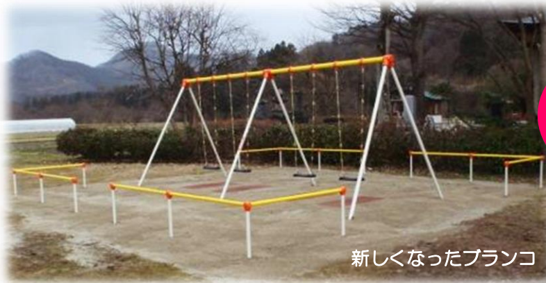
新しくなったブランコ